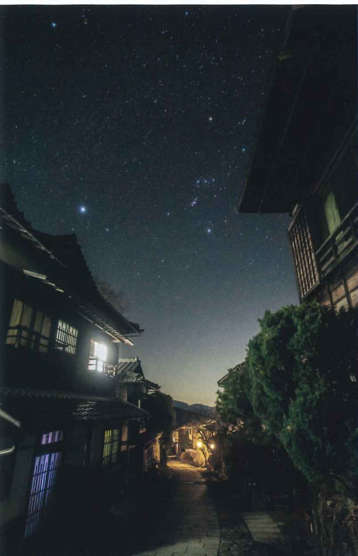
馬籠宿深更(岐阜県 中津川市) 井戸 英夫