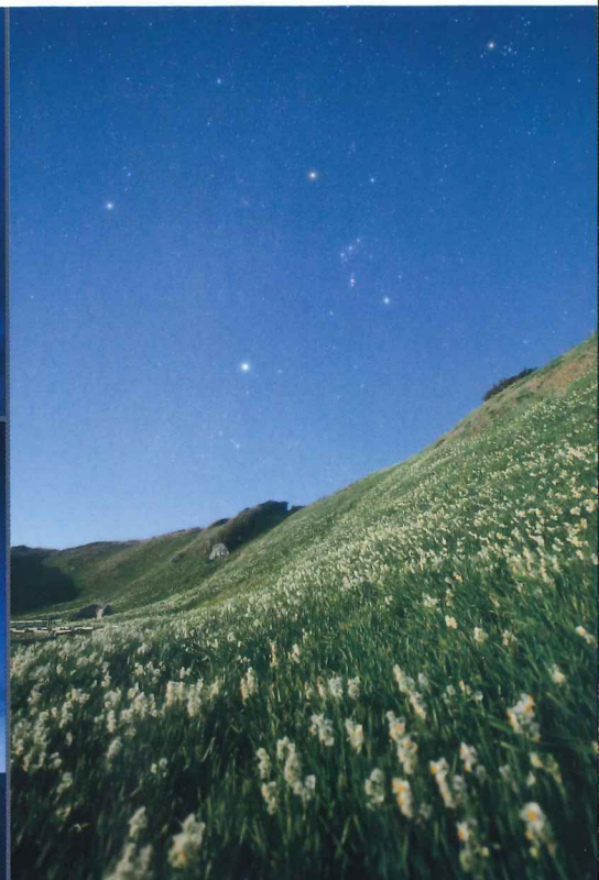
水仙と月夜の星空(静岡県 下田市) 安田 幸弘