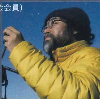
森から思索する宇宙 1、春の宇宙(長野県小谷村鎌池) 大西浩次